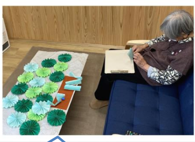
クリスマスツリーを作っています！