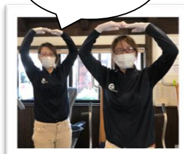
職員の冬服が新しくなりました！