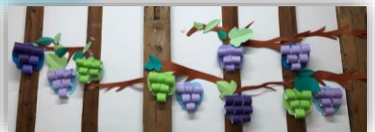
一日型利用者様の作品