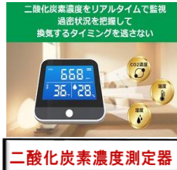
二酸化炭素濃度測定器

ハビリスでは全てのスタッフの コロナワクチン接種が終了いたしております。 ご利用者様に安心してご利用いただけるように 換気、消毒を行い、パーテーションを使用した 座席、軽食時は他の利用者様との距離を 取れる様に対策を引き続き行ってまいります。