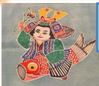
かぶとと鯉のぼりの紅型染め