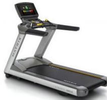
トレッドミル (ウォーキングマシン)