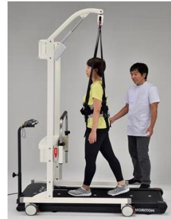
免荷式歩行リフト