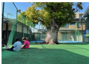
徐々に暖かくなり 屋外訓練も行っております